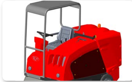
Tettuccio Canopy Techo