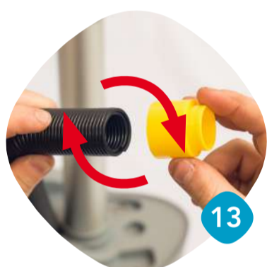
Gänga loss anslutningen.