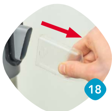
Ta loss utloppet.