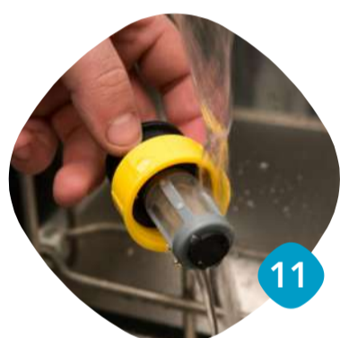
Skölj ren silen.