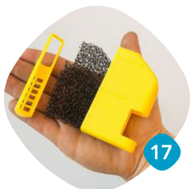
Kontrollera och rengör.