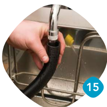
Skölj ur slangens.