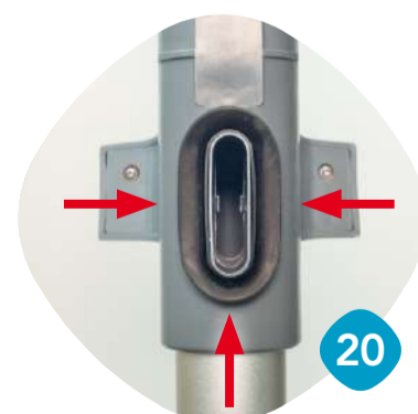
Kontrollera och rengör invändigt.