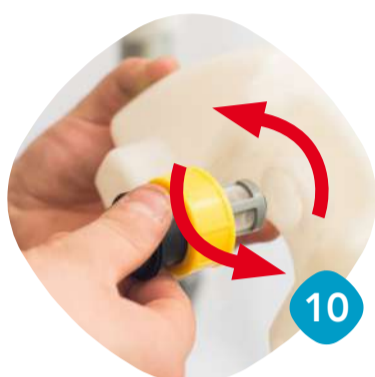
Gänga loss silen.