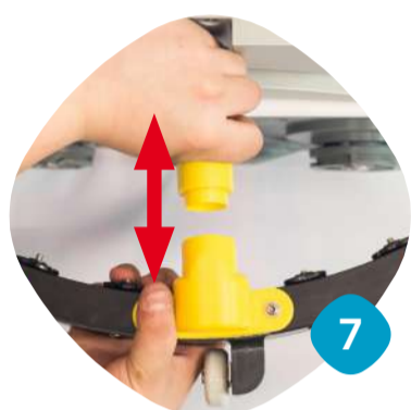
Ta loss slanganslutningen.