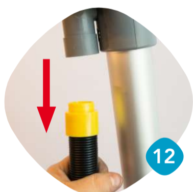
Ta loss sugslangen.