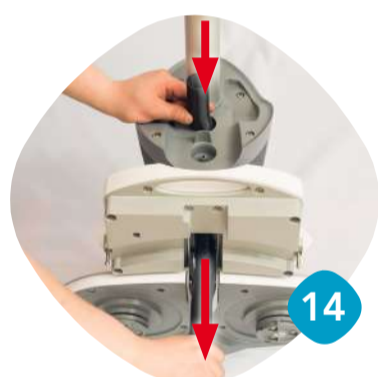
Dra ur sugslangen.