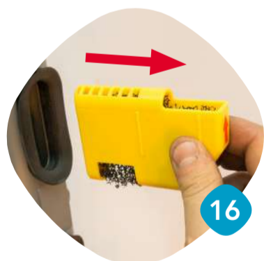
Ta loss filtret.