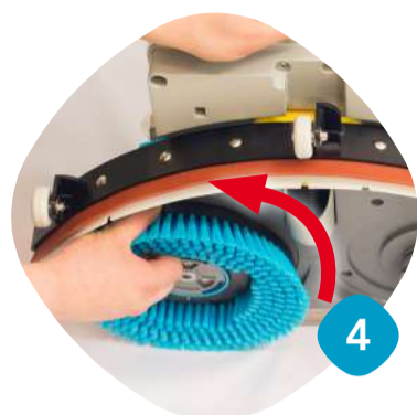
Ta loss borstarna.