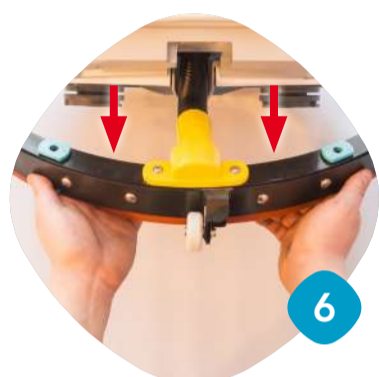
Ta loss sugskrapan.