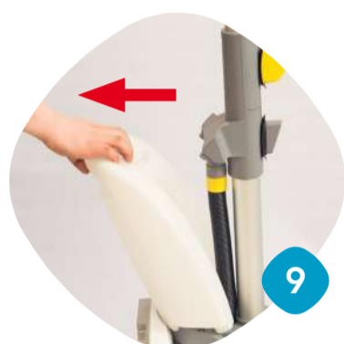
Ta loss renvattentanken.