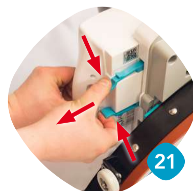
Ta loss batterierna.